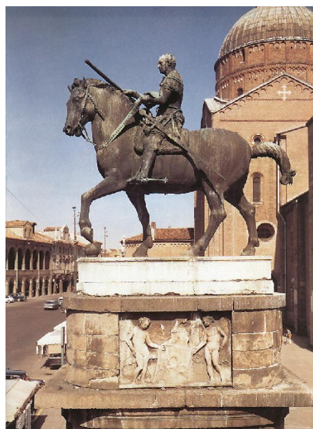
Lámina 2 (hasta 4 puntos). / Lámina 2 (ata 4 puntos).

Estudia esta obra iconográfica y formalmente (hasta 2 puntos) / Analiza iconográfica e formalmente esta obra (ata 2 puntos).