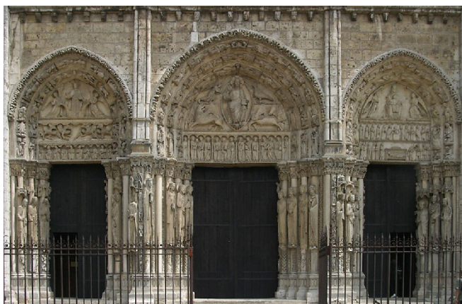
Lámina 2 (hasta 4 puntos) / Lámina 2 (ata 4 puntos)

Analiza iconográfica y estilísticamente esta obra (hasta 2 puntos) / Analiza iconográfica e estilísticamente esta obra (ata 2 puntos).