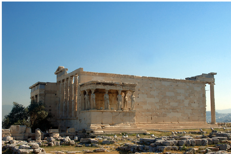
Lámina 2 (hasta 4 puntos). / Lámina 2 (ata 4 puntos).

Analiza tipológica y formalmente este edificio (hasta 2 puntos). / Analiza tipolóxica e formalmente este edificio (ata 2 puntos).