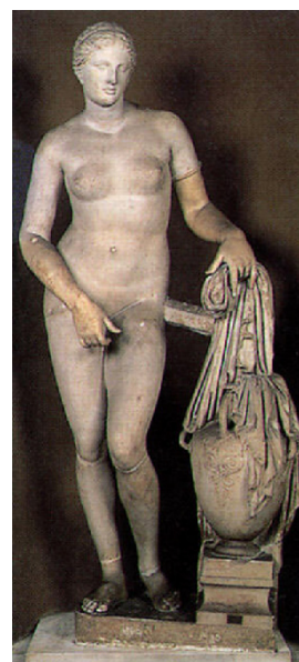
Lámina 2 (hasta 4 puntos). / Lámina 2 (ata 4 puntos).

Analiza iconográfica y estilísticamente esta obra (hasta 2 puntos) / Analiza iconográfica e estilisticamente esta obra (ata 2 puntos).